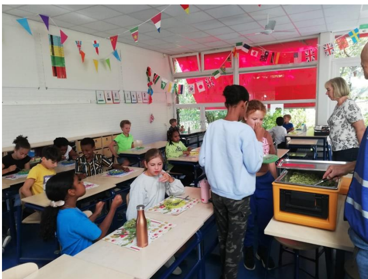
Kinderen van OBS de Wereld eten nu hun warme lunch in school zelf

Het project heeft in september 2022 een vervolg gekregen voor het hele schooljaar, welke duurt tot juli 2023. Echter werd er nu door praktische overwegingen gegeten in de klassen op de school zelf. Door het Buurtbedrijf wordt onderzocht hoe ouders meer betrokken kunnen worden bij het project. Een eerste stap hierin is gezet door ouders tijdens de meeloopdagen uit te nodigen om ook mee te komen eten in de klas.