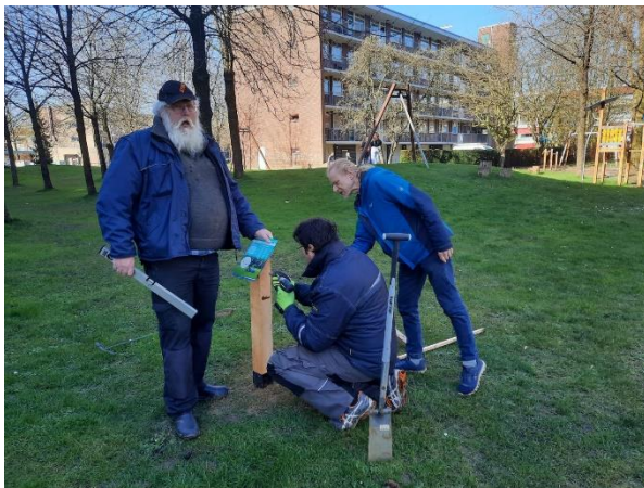
Aanleg en feestelijke opening beweegroute 'Wageningen on the Move'