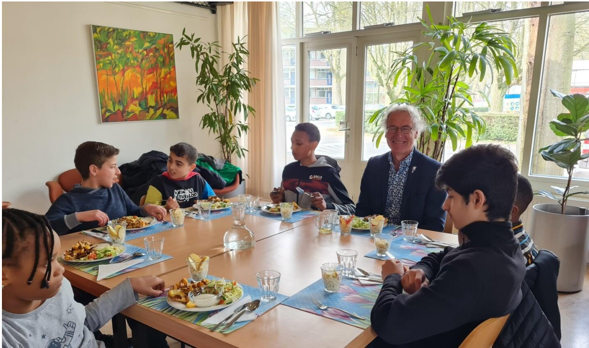
Kinderen van OBS de Wereld aan hun laatste warme lunch samen met wethouder Leo.

De effecten van de pilot zijn gemonitord en zijn in kaart gebracht.