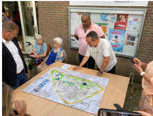
FEESTELIJKE OPENING PROJECT NUDERIJK