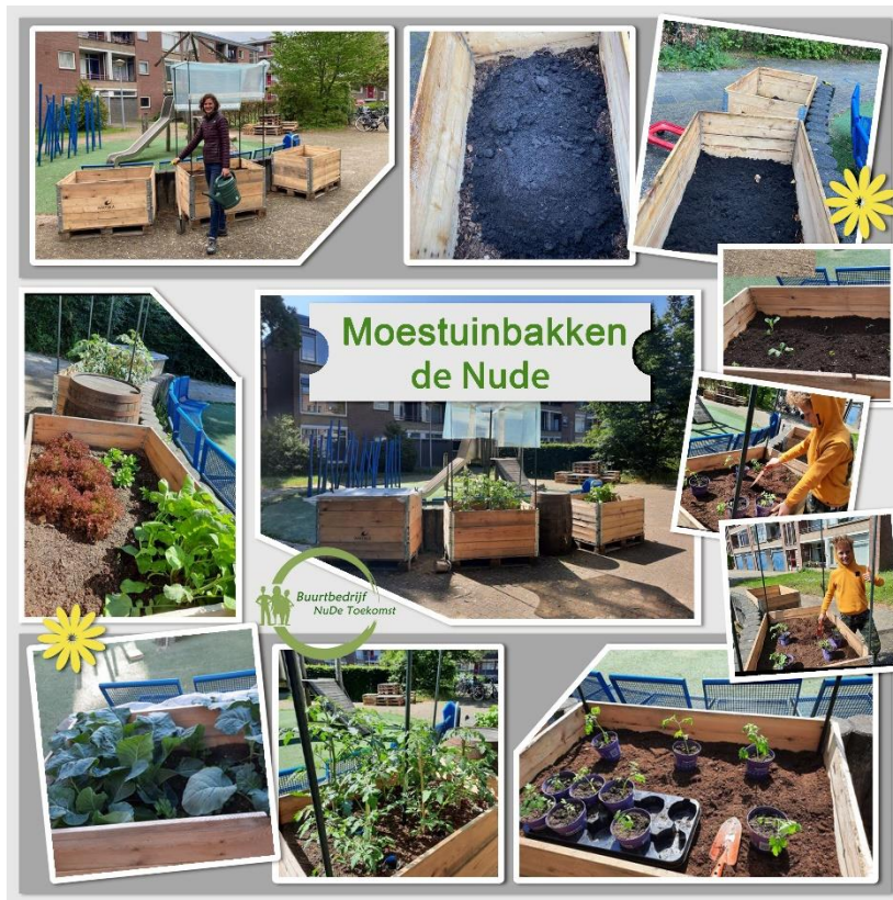
Moestuinbakken in de wijk de Nude

Met financiële ondersteuning van de Woningstichting hebben we via de HUB Voedsel & Gezondheid in maart 2021 moestuinbakken aangelegd in de wijk. De hele buurt mag hier gebruik van maken. Dit initiatief werd erg gewaardeerd door de bewoners en smaakt naar meer. Dit is voortgezet in 2022 en gekeken wordt naar uitbreiding voor in 2023.