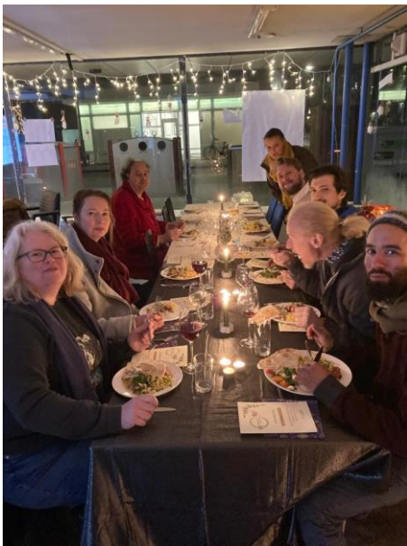
Vrijwilligersetentje in de Wasserette

We hebben oog voor onze vrijwilligers. We vragen regelmatig hoe het gaat en zeggen dankjewel. Op vrijdag 9 december 2022 hebben we als dank een etentje georganiseerd voor alle betrokken bewoners bij het Buurtbedrijf. Dit was een geslaagde avond, zie foto hieronder.